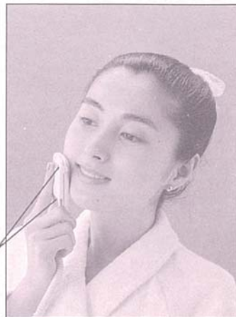
バフ部フィンガー電極